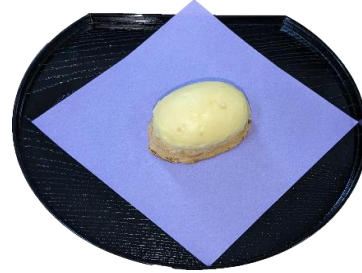
レモンケーキ ¥130(税込¥141)