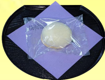
まんじゅう(白) ¥130(税込¥141)