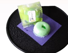
シークワサー饅頭