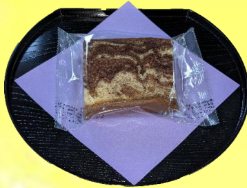
マーブルケーキ ¥130(税込¥141)