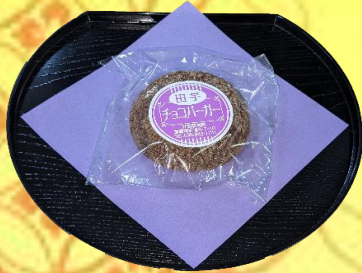
田芋チョコバーガー ¥130(税込¥141)