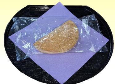
クリームポート ¥130(税込¥141)