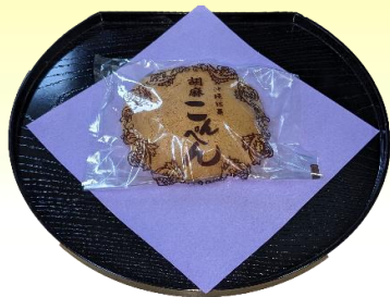
胡麻こんぺん ¥130(税込¥141)