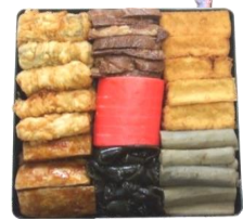
重箱おかず (赤かまぼこ) (7品)