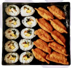
重箱いなり/巻き (巻き10個) (いなり10個)