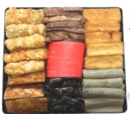
重箱おかず (赤かまぼこ) (7品)