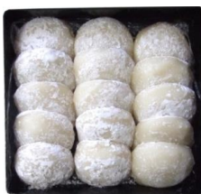
重箱もち (15個入) (白もち/あんもち)