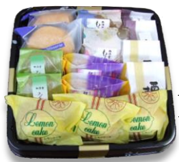
和菓子詰合せ 15個入