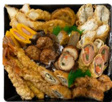
重箱おかず 洋風アレンジ