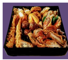
重箱おかず洋風アレンジ