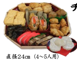
チャワキ オードブル もち5個付

※もちは白・あん・から選べます 魚天ぶら、豆腐、昆布 ごぼう、ハム巻き、 チキンから揚げ、三枚肉、