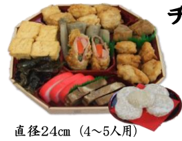
チャワキ オードブル もち5個付

※もちは白・あん・から選べます 魚天ぶら、豆腐、昆布 ごぼう、ハム巻き、 チキンから揚げ、三枚肉、