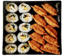
重箱いなり/巻き (巻き10個) (いなり10個)