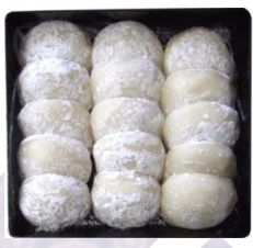
重箱もち (15個入) (白もち/あんもち)