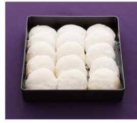
もち重箱 (シロ・アン)