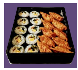
いなり・巻き重 (巻き10個、いなり10個)