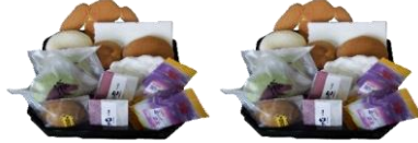
盛菓子1対 (和菓子アレンジ)