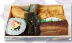
うちぢへいし(清明祭用) (巻き寿司、いなり、三枚肉、ごぼう、 昆布、かまぼこ、豆腐、魚天)