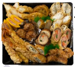
重箱おかず 洋風アレンジ