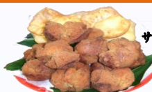
カタハランプー サーターアングギー 盛り合わせ