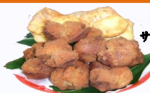
カタハランプー サーターアングギー 盛り合わせ