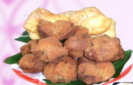
カタハランプー サーターアングギー 盛り合わせ