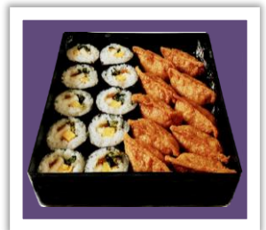
いなり・巻き重 (巻き10個、いなり10個)