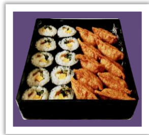
いなり・巻き重 (巻き10個、いなり10個)