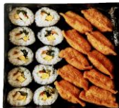
重箱いなり/巻き (巻き10個) (いなり10個)