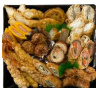
重箱おかず アレンジ