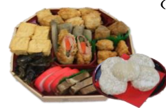
チャワキ オードブル もち5個付き