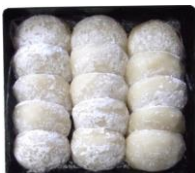
重箱もち (15個入) (白もち/アンもち)