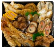
重箱おかず アレンジ