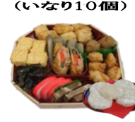
チャワキ オードブル もち5個付き