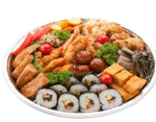
オードブル 小 (7～8人用)