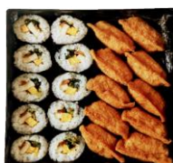
重箱いなり/巻き (巻き10個) (いなり10個)